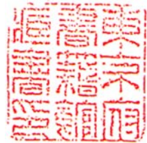
蔵書館東 書籍府 印