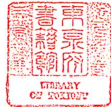
紀元二千五百 三十七年 東京府 書籍館 印