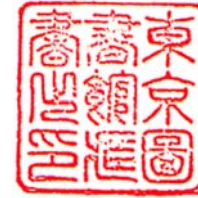
書書東 之館京 印蔵図