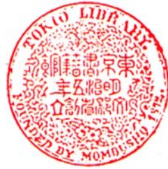
館籍書京東 年五治明 立創省部文

明治8年(1875)5月: 文部省から新たに交付された蔵書約1万冊を基本蔵書として、閲覧開始。 明治10年(1877)年2月: 廃止を決定。